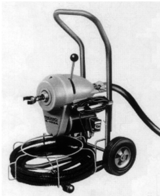
Рис. 3: Хранение тросов

ВНИМАНИЕ: После использования тщательно промыть тросы и соединительные муфты водой и просушить их, поскольку некоторые химические соединения для чистки канализации обладают разрушающим действием.