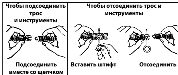
Рис. 1: Соединение и разъединение тросов и инструментов

ПРИМЕЧАНИЕ! Быстросъемный соединитель (рис. 1) обеспечивает самый простой способ смены инструментов и тросов. Быстросъемные соединители можно устанавливать дополнительно на все существующие инструменты и тросы.